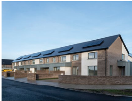
Tuarascáil Bhliantúil 2018

Riaradh cláir dheontais le haghaidh oibreacha a bhaineann le hoidhreacht agus thug an tOifigeach Caomhnaithe tacaíocht do Ranna eile maidir le saincheisteanna a bhaineann le hoidhreacht. Ullmhaíodh os cionn 90 Tuarascáil Phleanála maidir le hiarratais phleanála a bhaineann le Struchtúir Chosanta agus ACAanna.