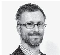
Roderic O'Gorman, An Comhaontas Glas