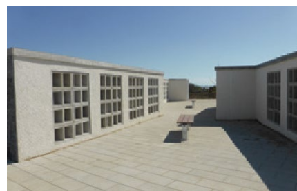
Balla Adhlactha Cholóimiam