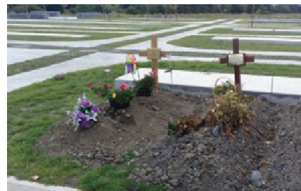
Reilig Bhaile Ghrifin

Déantar roinnt cuanta agus céanna a bhainistiú agus a chothabháil i mBaile Brigín, sna Sceirí, ar an Ros, i Loch Sionnaigh agus ar Mhullach Íde.